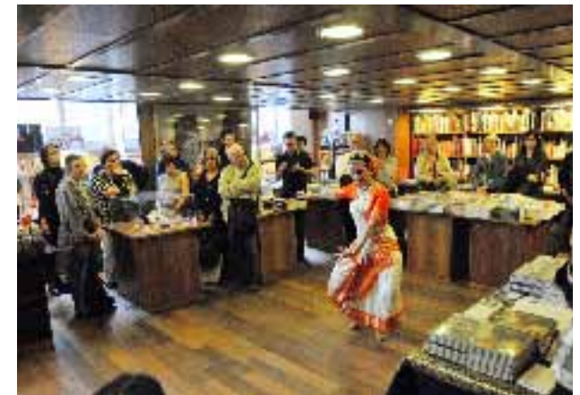
Présentation de l'exposition et extrait dansé au Musée des Arts Asiatiques Guimet, Paris, avril 2010